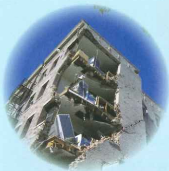
地震・津波で建物が倒壊、 損害を受けた…

専門のコンサルタントが 隠れたリスク を “見える化” し、 貴社に適したリスク対策をご提供いたします。