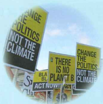
海外子会社が現地の暴動により 社屋が損壊した…