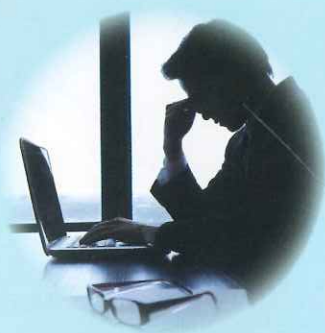
過労死の労災事故で 高額賠償が…