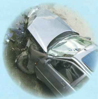
営業車が近隣の人と事故、 相手方が死亡してしまった…